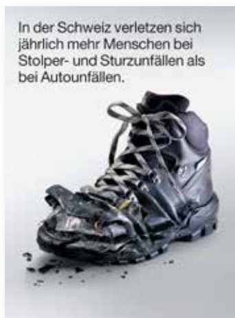
Stolpern ist ein Thema: Suva-Plakat

Es fiel auf, dass es viele Stolperfallen gibt, die zu Unfällen führen können. Gemäss den Statistiken der Suva ist jeder dritte Unfall im Beruf oder im Freizeitbereich auf Stolpern zurückzuführen. Aufgrund dieser Feststellungen, und um die Mitarbeitenden in einem Workshop zu sensibilisieren, wurde am Sicherheitstag des Amts für Industrielle Betriebe das Thema Stolpern aufgegriffen.