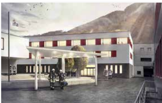
Für eine Investitionssumme von rund 9 Millionen Franken entsteht in den Jahren 2016/17 auf dem ifa-Gelände in Balsthal ein neues, zeitgemässes Schulungsgebäude. Es ersetzt den bald 70-jährigen Vorgängerbau, der den heutigen Anforderungen nicht mehr genügt. Bild: Visualisierung des neuen Schulungsgebäudes