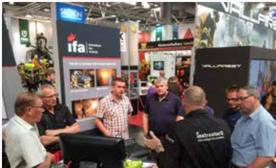
Zahlreich und fruchtbar waren die Kontakte am Stand der International Fire Academy an der „Interschutz“ in Hannover.