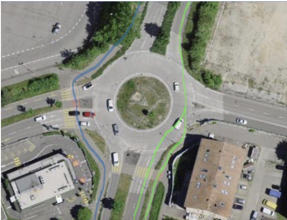
Abbildung 1: Ist-Zustand MFP-Kreisel in Münchenstein. In Grün die unattraktive Route nach Basel, in Blau die attraktive Route von Basel Richtung Süden.